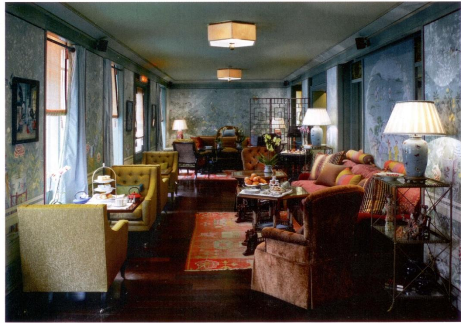
Une déco qui rappelle celle des plus belles maisons privées.